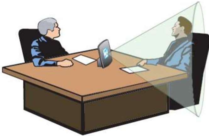
Typowe zastosowanie PL1/K1 w pokoju